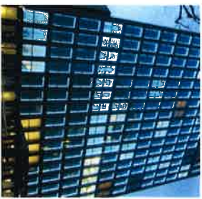
© G. L. / A. / A. / A.