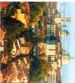
© G. L. / A. / A. / A.

« Dans une ville qu'on appelle Bergame, j'ete ferias construire une villa » chantait Diane Tell. La ritournelle a plus fait pour l'image de la ville que n'importe quelle publicité ! A une cinquantaine de kilomètres de Milan, Bergame dévoile deux visages : une ville basse moderne et une exquise cité médiévale plantée sur un rocher et cernée par 6 km de remparts. On vient d'abord ici pour sa place bordée d'un palais vénitien et dominée par une tour carrée du Moyen Âge dont l'horloge sonne 100 coups tous les soirs, à 22 h ! Entre leblouissante chapelle Colleoni ornée de marbres colorés et la niche basilique Santa Maria Maggiore, le poids de l'histoire est omniprésent ; jusque dans les ruelles