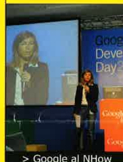
> Google al NHow

Dopo il successo dello scorso anno, è giunto in Italia il roadshow internazionale di Google Web Developer Day , un happening in cui sviluppatori, blogger e web developer di tutta Italia hanno avuto la possibilità di incontrare gli ingegneri Google e interagire con loro tramite seminari e workshop per conoscere meglio, in via teorica e pratica, segreti e novità delle applicazioni. L'organizzazione dell'evento anche quest'anno è stata affidata all'agenzia milanese Studiometria. La location, che doveva disporre di una sala plenaria da oltre 350 persone e spazi per 19 seminari e workshop in contemporanea e avere un appeal contemporaneo, trendy ma informale, secondo lo stile di Google, è stato l'Hotel NHow, e l'attiguo T35, per l'area lounge dedicata a registrazione, welcome coffee, buffet lunch e cocktail di chiusura. La tecnologia doveva essere al top anche per permettere la connessione wi-fi di oltre 300