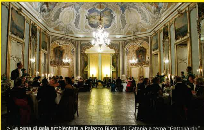
> La cena di gala ambientata a Palazzo Biscari di Catania a tema "Gattopardo"