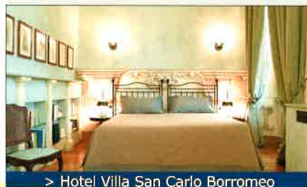
&gt; Hotel Villa San Carlo Borromeo